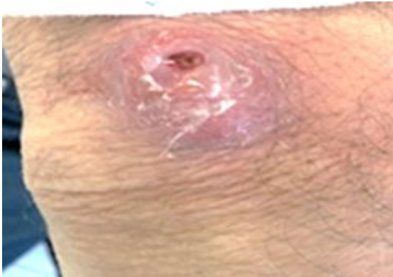
شکل ۳: نمای ضایعه مچ دست بیمار ب