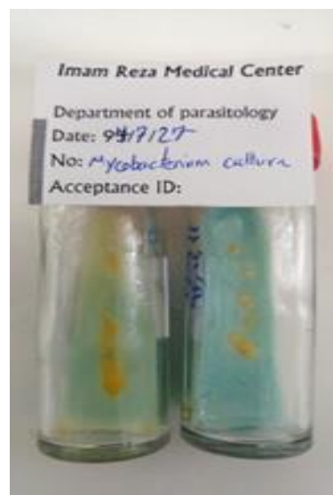
شکل ۸: کلنی‌های مایکوباکتریوم محیط

فراوانی گونه‌های باکتری‌های غیر سلی (Nontuberculous mycobacteria (NTM) طبق قانون DOTS (هر چه میزان مایکوباکتریومهای سلی کاهش پیدا کند در عوض مقدار مایکوباکتریومهای غیر سلی رو به افزایش است (۱۱، ۱۰). شبهات ضایعات پوستی مایکوباکتریومی به ضایعات لیشمانیوز جلدی که معمولا به شکل پاپولها و ندول‌هایی سطحی به همراه پلاک‌های اریتروماتوز دیده می‌شوند سبب می‌شود که در تشخیص اولیه، این دو بیماری با هم اشتباه شوند. فتی و همکاران اولین بار در دومین کنگره بین‌المللی انگل‌شناسی چند بیمار را که با تابلو لیشمانیوز جلدی توسط پزشکان متخصص پوست جهت انجام آزمایش از نظر سالک به آزمایشگاه معرفی شده بودند ارائه نمود (۱۲). علاوه بر این در لیشمانیوز تعدد ضایعات در اثر گزش‌های متعدد و در مایکوباکتریوزیس وجود ضایعات اقماری در اطراف زخم و فرم اسپروتریکوئیدی، باعث ایجاد شبهات دیگری در فرم بالینی ضایعه می‌شود (۱۳). هر دو نوع زخم معمولا برای چندین ماه باقی می‌ماند، بنابراین از نظر سن ضایعه نیز به هم مشابه‌اند. از این رو تشخیص زخم‌های سالک و مایکوباکتریوم به ویژه در مناطق آندمیک از اهمیت خاصی برخوردار است.