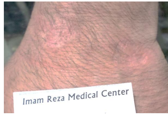
شکل ۶: اسکار پس از بهبودی ضایعه مچ دست بیمار ب