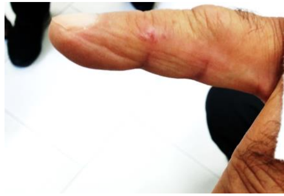
شکل ۴: اشکال وزیکولی اقماری در حاشیه