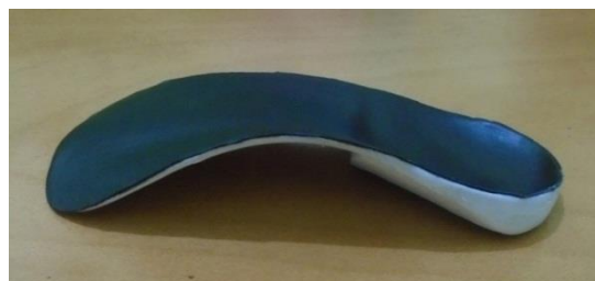
شکل ۱: نمای جانب داخلی کفی مورد استفاده در پژوهش

فرکانس نمونه برداری برابر 1000 \text{ Hz} تعیین شد. برای تحلیل داده های صفحه نیرو از نرم افزار BioWare (5.3.0.7) استفاده شد. این دو تخته نیرو در امتداد یکدیگر، با فاصله ۱ سانتی متر از هم در نیمه راه یک مسیر ۲۰ متری طوری قرار گرفته بودند که آزمودنی حداقل ۵ گام قبل از رسیدن به تخته نیرو بر می داشت و مانعی به ارتفاع ۴۰ سانتی متر در مسیر دوییدن افراد تعبیه شده بود که افراد با پرش تک پا از روی این مانع عبور کرده و با هر دوپا بر روی تخته نیرو فرود می آمدند. اگر آزمودنی با تک پا فرود را انجام می داد و یا روی لبه صفحه نیرو فرود را انجام می داد این موارد حذف می شد و آزمایش مجدداً تکرار می شد. سرعت گام برداری افراد با مترنوم کنترل می شد. قبل از شروع ثبت داده ها، ابتدا تخته نیروها کالیبره شدند.