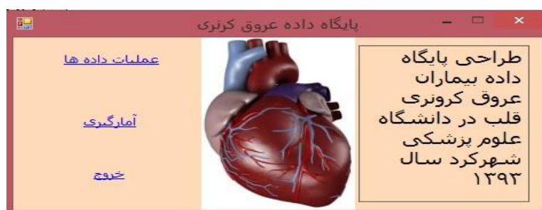
شکل ۱: صفحه اصلی پایگاه داده بیماران عروق کرونر قلب به منظور عملیات داده، گرفتن گزارش و خروج از برنامه