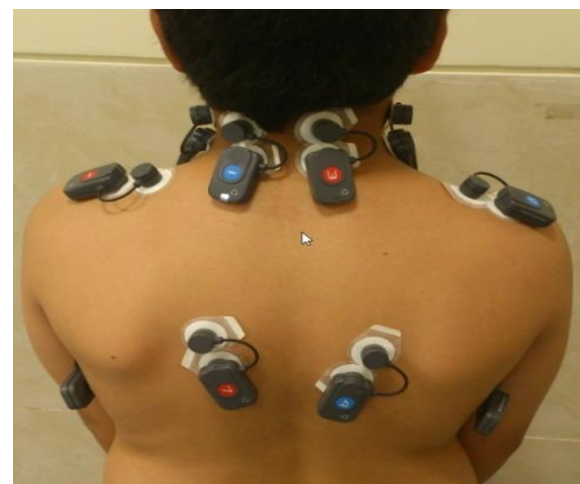
شکل ۲: محل نصب الکترودها بر روی عضلات منتخب

شکل ۱: روش اندازه گیری زاویه سر به جلو با استفاده از گونیامتر. آزمون گر با قرار گرفتن در سمت راست آزمودنی بازوی ثابت گونیامتر را عمود بر زمین و بازوی متحرک را روی زانده خاری مهره ی هفتم گردن و تراگوس تنظیم کرده و زاویه بین بازوی متحرک و خط موازی با زمین که از مهره ی هفتم عبور می کرد را به عنوان زاویه سر به جلو ثبت گردید.