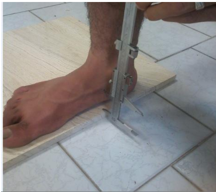
شکل ۲: اندازه‌گیری افتادگی استخوان ناوی

به‌منظور تعیین ناهنجاری پا، از اندازه‌گیری درجه پرونیشن مفصل تحت قاپی توسط آزمون شاخص افتادگی استخوان ناوی استفاده شد (۳۲). با استفاده از روش توصیف شده توسط برودی ۲ (۳۳)، افتادگی استخوان ناوی، ارزیابی شد. اندازه‌گیری افتادگی ناوی در هر آزمودنی سه بار انجام شد و میانگین آنها به‌منظور طبقه‌بندی افراد در دو گروه پای طبیعی، پای صاف (چرخیده به خارج) به کار رفت. آزمودنی‌ها دارای با افتادگی ناوی بیشتر از ۱۰ میلیمتر، در گروه کف پای صاف؛ بین ۴ تا ۹ میلیمتر، در گروه کف پای طبیعی قرار گرفتند (۳۳). این آزمون دارای اعتبار و پایایی لازم و مناسب برای سنجش مقدار پرونیشن پا است. (۳۴)، (شکل ۲).