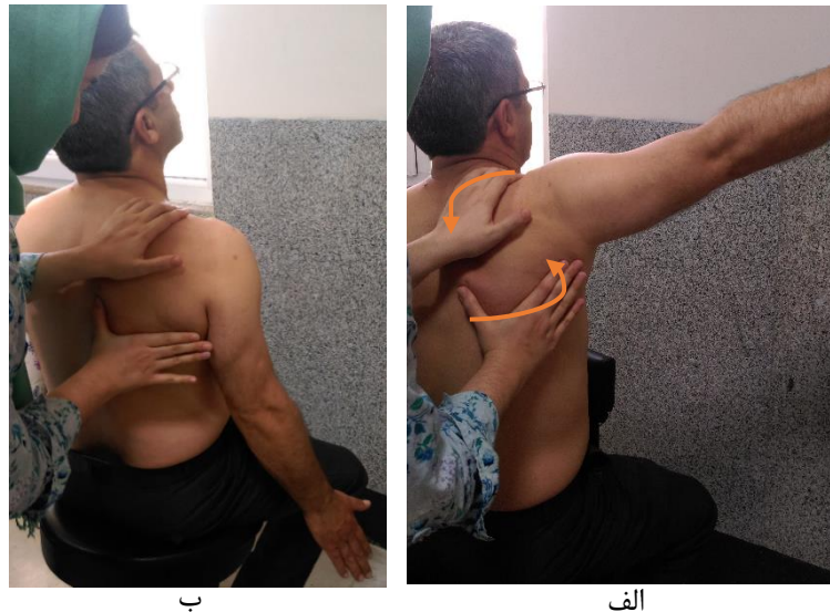
شکل ۴: نحوه انجام آزمون همراهی کتف

(فرضیه صفر این آزمون، انطباق مناسب و قابل قبول توزیع متغیرها با توزیع نظری نرمال می‌باشد یا به عبارت دیگر مقدار p^1 این آزمونها بالاتر از ۰/۰۵ می‌باشد) نتایج این آزمون در جدول ۲ برای هر دو گروه سندرم گیرافتادگی شانه و پارگی نسبی عضلات چرخاننده کتف ارائه شده است. متغیرهای مورد بررسی شامل درد شانه در حین حرکت قبل از آزمون، درد شانه در حین آزمون همراهی کتف، دامنه های حرکتی Flexion، Abduction و Scaption شانه و نمره پرسشنامه ناتوانی اندام فوقانی در آزمون پرسشنامه ناتوانی اندام (p<۰/۰۰۱)، قسمت مربوط به کار پرسشنامه ناتوانی اندام فوقانی (p=۰/۰۰۱)، دامنه حرکتی Flexion (p=۰/۰۲)، دامنه حرکتی Scaption (p=۰/۰۰۰۹) و درد شانه حین آزمون همراهی کتف (p=۰/۰۴۸) در بین دو گروه مبتلا به سندرم گیرافتادگی شانه و پارگی نسبی تاندون عضلات چرخاننده کتف تفاوت معنی‌دار را نشان می‌دهند. نکته حائز اهمیت در این بررسی معنی‌دار نشدن آزمون همراهی کتف در بین دو گروه می‌باشد. بدین معنی که توانایی تشخیصی آزمون همراهی کتف در اختلال راستای کتف بین بیماران مبتلا به سندرم گیرافتادگی شانه و پارگی نسبی عضلات چرخاننده کتف به یک میزان نبوده است.