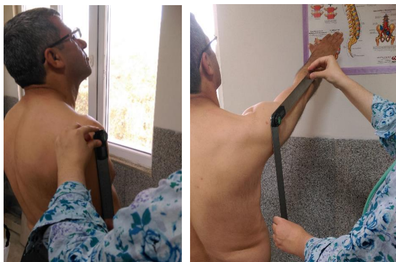
الف ب شکل ۳: نحوه اندازه‌گیری دامنه حرکتی Flexion